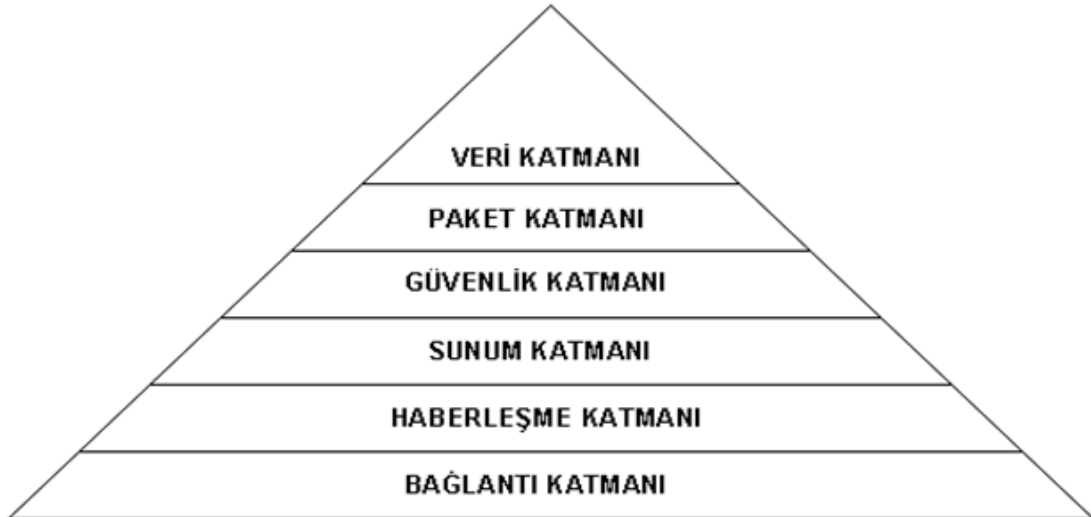
Şekil -2 : Veri Aktarım Protokolü Katmanlı Mimari