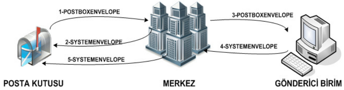
Şekil -4: Ticari Fatura Senaryosu

Ticari fatura senaryosunda, Posta Kutusu gelen faturayı KABUL, RED veya İADE etme hakkına sahiptir. Ticari fatura senaryosunda, temel fatura senaryosuna ek olarak aşağıdaki adımlar uygulanır: